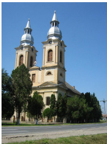
A „kalapos” templom, egy felújított sváb ház és a vendégfogadó „Schwabenhaus”

Sándorháza (Şandra, Alexanderhausen) viszonylag fiatal település. 1833-ban alapították 140 telepes családdal. Így történhetett meg, hogy ebben a faluban a svábok, tulajdonképpen őslakosoknak számítanak. Körkörös kialakított faluközpontja van, melyet az impozáns – kalaposnak is nevezett – római katolikus templom ural. Ugyanitt találkozunk a nyugati civilizáció egyik eukonform létesítményével is. A templom, valamint a szépen kimunkált világháborús emlékmű szomszédságában, egykori sváb parasztgazdaság épületeiben modern panziót alakítottak ki – „Schwabenhaus”.