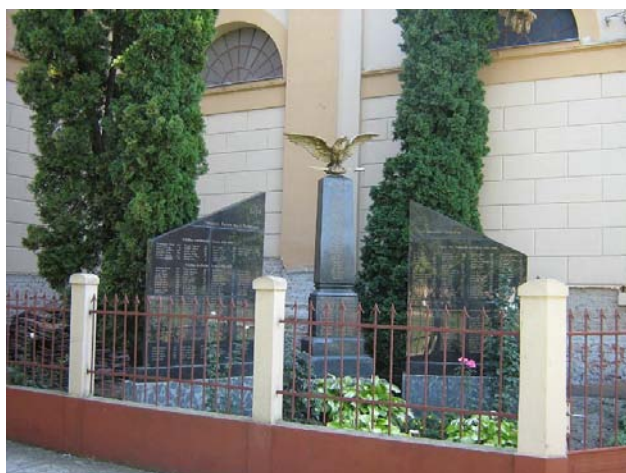
Biléd: A kálváriadomb és ... az áldozatok hosszú névsora

Sándorháza (Şandra, Alexanderhausen) viszonylag fiatal település. 1833-ban alapították 140 telepes családdal. Így történhetett meg, hogy ebben a faluban a svábok, tulajdonképpen őslakosoknak számítanak. Körkörös kialakított faluközpontja van, melyet az impozáns – kalaposnak is nevezett – római katolikus templom ural. Ugyanitt találkozunk a nyugati civilizáció egyik eukonform létesítményével is. A templom, valamint a szépen kimunkált világháborús emlékmű szomszédságában, egykori sváb parasztgazdaság épületeiben modern panziót alakítottak ki – „Schwabenhaus”.