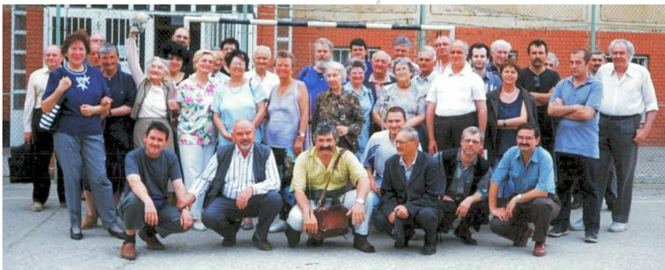
Ennyien voltunk a Bartók Béla líceum udvarán