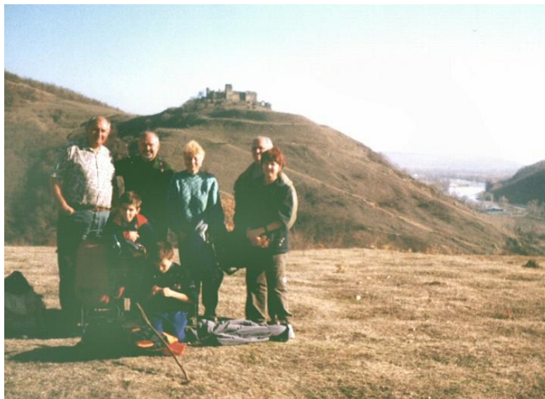
A temesvári EKE-csoport legelső kirándulásán

1456-ban Hunyadi János birtoka lett, majd Mátyás királyé, aki 1462-ben a cseh Giskra János huszita vezérnek adományozta. A király azonban már 1471-ben elvette tőle és Arad vármegye főispáni