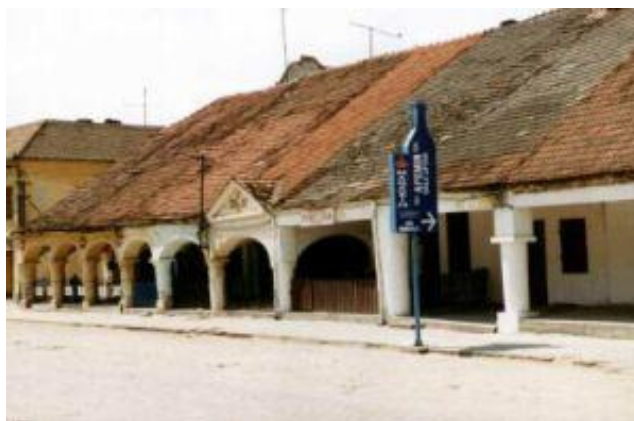
Az egykori török bazár épülete Lippán