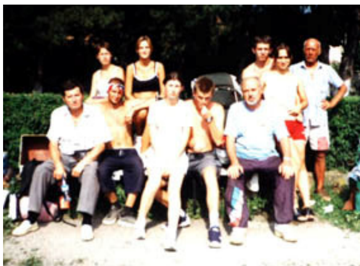
Bánsági EKE-sek, hazafelé a vándortáborból, vonatra várnak a Csucsai vasútállomáson

Utolsó este 1200 személynek főztek közös vacsorát és a táborúzó mellett hajnalig szólt a magyar nóta. A 2002-es vándortábor Gyergyószentmiklós és a Gyilkostó között rendezik meg az országút közelében, egy bővizű patak mentén. Remélem tőlünk is többen eljönnek erre a magasztos turista fesztiválra. Arra kell gondolnunk, hogy ennek lebonyolítása egyszer majd a mi feladatunk lesz és ezt bizony idejében meg kell tanuljuk másoktól.