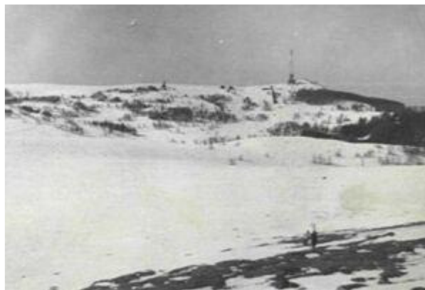
Így látszott a Goznakó, immár TV-toronnyal, a Szemenik-csúcs szikláiról 1975 telén

A másolat híven követi a diktandó füzetbe rótt eredeti szöveget, csak a változó helyesírási szabályok szerint korrigáltunk.