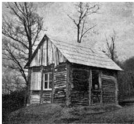
Az EKE boksáni osztályának menedékháza félig kész állapotban, 2 Km-nyire a boksánbányai állomástól.