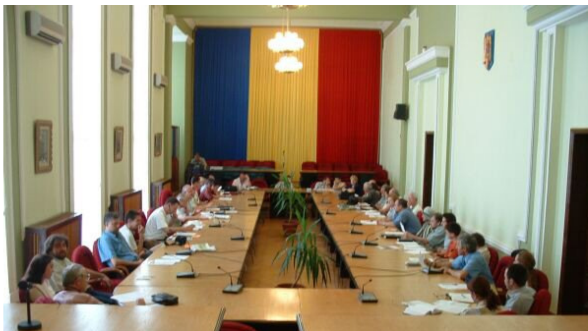
Természetbarátok a tanácsasztal körül

A tizennégy hazai, öt magyarországi és egy szerbiai turistaegyesületet képviselő közel száz résztvevőnek a kétnapos túra során alkalma nyílt a nemzetközi turizmus szempontjából még „szűz” terület természeti csodáival – de egymással is – jobban megismerkedni, a jövőbeli együttműködést megalapozni. A résztvevők legközelebbi találkozójukat július elejére, a Makói határmenti turista találkozó idejére beszélték meg. (Pataki Zoltán)