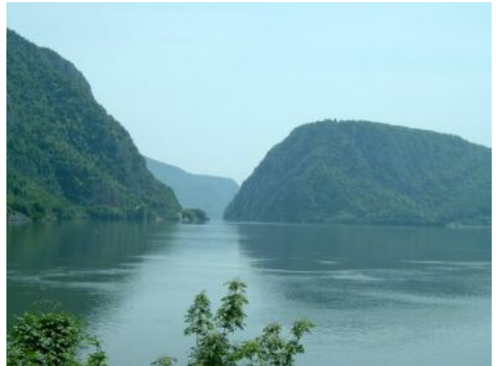
A Nagy-Kazán

rejteget, melyekből eddig hetet azonosítottak. Közülük a leghíresebb a Poncova barlang, melynek bejárata közelében az azonos nevű patak egy rövid és vad szurdokvölgyet valamint egy természetes 6 – 8 méter magas és 25 méter hosszú természetes hidat kreált a sziklába az idők során. Maga a barlang 1666 méter hosszú és miután átfúrja magát a Ciucanul Mare (Nagy Sukár) hegy alatt, nyugalmat a Duna medrében lel magának.