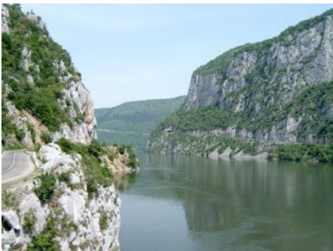
A Kis-Kazán

A karsztikus jelleg lépten-nyomon fellelhető, hol erőteljesen uralva a felszínt mint a Kis-Kazán esetében, hol rejtetten – például zombolyok alakjában – főleg a Nagy-Kazán környékén. A föld mélye pedig barlangokat