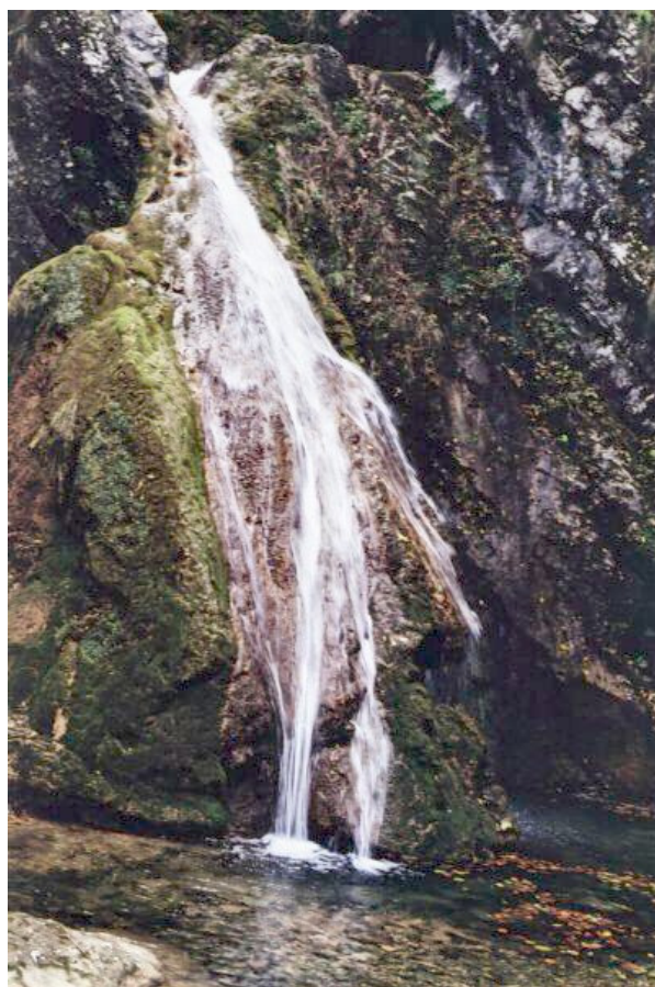
A Susara vízesés

A turistaság nem csak kellemes öncél, hanem közhasznú működés is. Hazánk kies tájainak megismertetése, az utazó közönséggel való megkedveltetése, hozzáférhetővé tétele olyan közhasznú és hazafias vállalkozás, melynek jogosultságát, sőt szükségességét másutt már évtizedek óta elismerték, mely vállalkozás szolgálatában a külföldön számtalan egyesület áll a tagok százezreivel. Nálunk ez az ügy még mindig a kezdet kezdetén van; szerény eszközökkel küzdünk a közönség előítélete, elfogultsága és közönye ellen, - természetes, hogy az így elérhető eredmények is szerények; a felvirágzást még mindig a jövőtől kell várnunk."