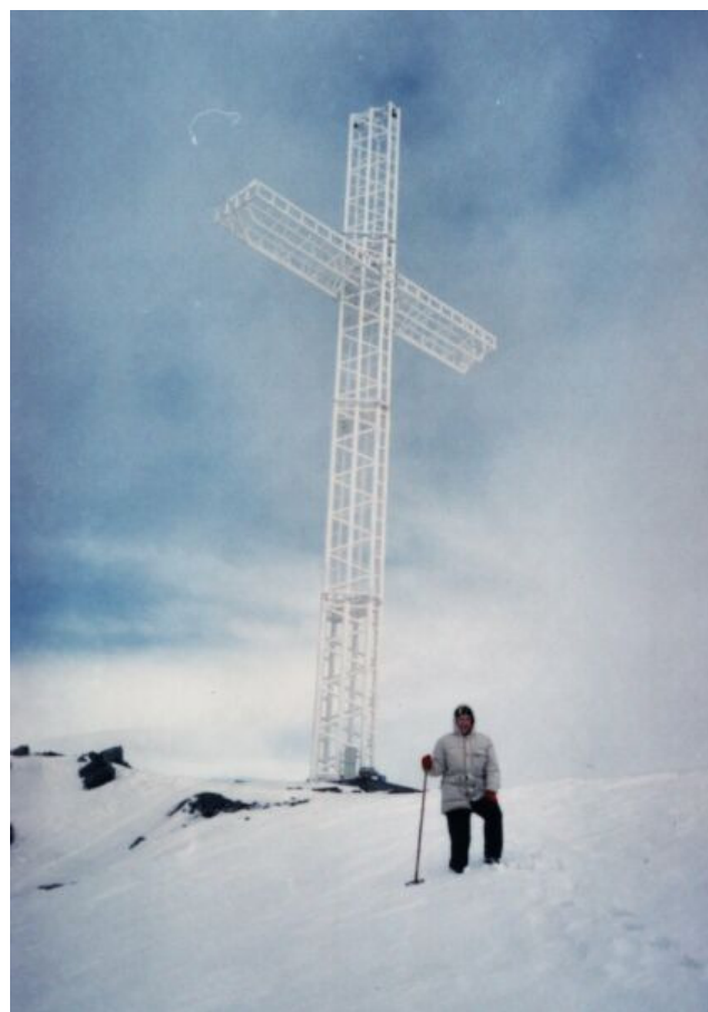
A felavatásra váró új kereszt

2003-ban felállítottak egy acélcsővekből készített 28 méter magas keresztet, a régi helyére mert az már megkorhadt. A keresztet, éjjel ha kivilágítják, 50 km távolságból is lehet majd látni. Az építmény készen áll, csupán egy beton előteret és valamilyen díszítő elemeket óhajtanak még hozzáépíteni. Valószínűleg idén júliusban, Szent Illés napja táján, valamelyik hétvégén fogják felszentelni, mert állítólag ő a gugulanok (a Godján hegységbeli Gugu csúcsról elnevezett hegyi lakosság gyűjtőneve), valamint a pásztorok védőszentje. Az 1936-os ünnepélynél is nagyobb tömegre számítanak.