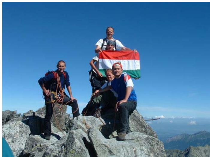
Magyarországi és Erdély-i turisták a Gerlachfalvi csúcson, szlovák idegenvezetővel

A Magas Tátra (Vysoké Tatry) a világ egyik legkisebb kiterjedésű magashegysége, egyúttal itt találhatóak a Kárpátok legmagasabb csúcsai, melyek meghaladják a 2600 métert (például a Gerlachfalvi csúcs, 2655m). A hegység fenséges látványt nyújt a Szepesti medence felől, mivel hirtelen emelkedik a magasba. Hossza csupán 27 km, szélessége pedig 17 km, de ha nyugat felől hozzászámítjuk a Liptói havasokat és kelet felé a Bélai havasokat is, akkor a Magas Tátra teljes hossza 76 km. Északi része, amely átnyúlik Lengyelország területére is, meredekebb, vadabb míg déli része szelídebb. Geológiai összetétel szempontjából nagyrészt gránithegység, ennek köszönheti magasságát.