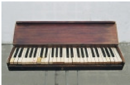
A néma zongora

Bejárta Olaszország, Németország, Svájc és Ausztria legszebb vidékeit. 1886-ban a Magyarországi Kárpát Egyesület rendes tagjává választja. Apja halála (1890) után teendőit gazdaszülőjére bízta, és a továbbiakban csak a hegyeknek szenteli életét. Soha nem nősült meg. Nem tartotta helyénvalónak a házasságot egy olyan ember számára, aki az év tizenkét hónapjából kilencet távolt töltött otthonától.